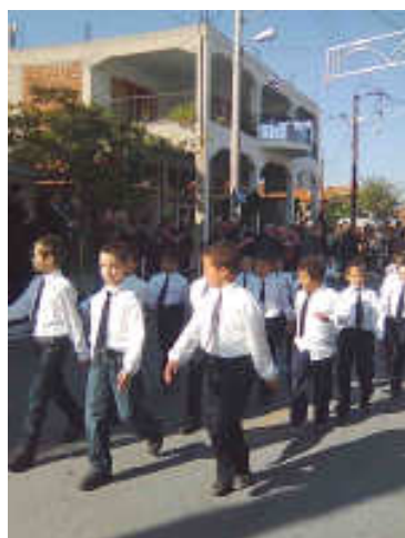
Το τμήμα των αγοριών και των κοριτσιών των μικρών τάξεων