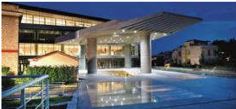
Το νέο Μουσείο της Ακρόπολης

Ευχαριστούμε θερμά το Διοικητικό Συμβούλιο του Συλλόγου, το Δήμαρχο κ. Σαραμάντο Δημήτριο και το Δημοτικό Συμβούλιο.