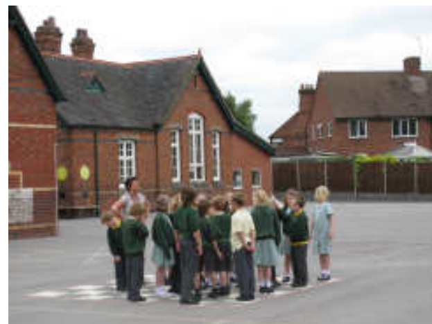
Η κ. Λην με την τάξη της στη "σκακιέρα" του σχολείου