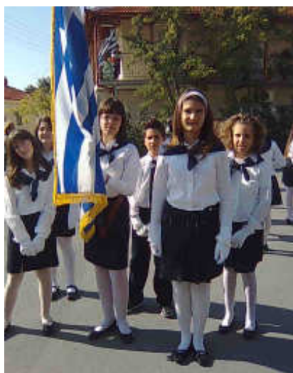
Η σημαιοφόρος με τους παραστάτες