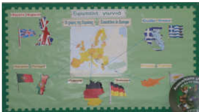
Η ευρωπαϊκή γωνιά του σχολείου της Κύπρου