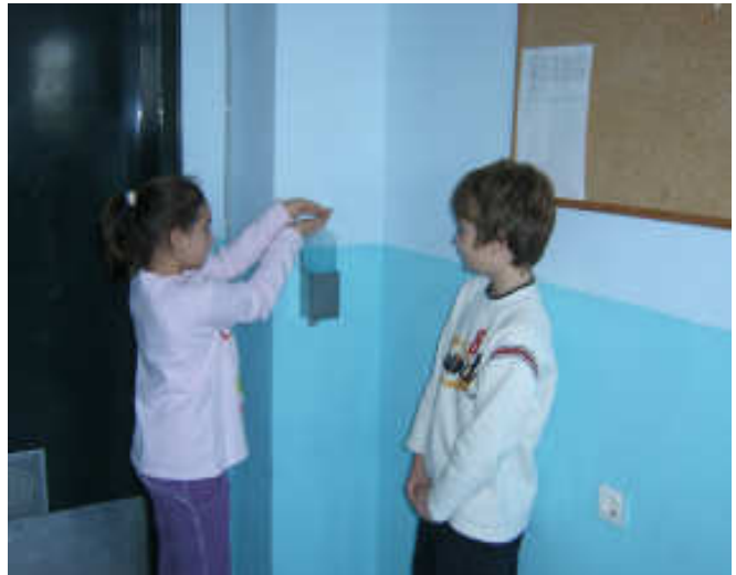
Μαθητές της Γ' τάξης χρησιμοποιούν υγρό αντισηπτικό από την αντλία που έχει τοποθετηθεί στην αίθουσά τους

Οι απουσίες μαθητών και εκπαιδευτικών καταχωρούνται ηλεκτρονικά σε καθημερινή βάση από το Υπουργείο Παιδείας, ενώ, σύμφωνα με πρόσφατη εγκύκλιό του, διακόπτεται η λειτουργία ενός τμήματος όταν εμφανίζονται τέσσερα (4) ή περισσότερα παιδιά από το ίδιο τμήμα με συμπτώματα γρίπης (πυρετό μεγαλύτερο ή ίσο με 38 °C που συνοδεύεται με ένα τουλάχιστον από τα παρακάτω: βήχα, πονόλαιμο, συνάχι). Για να διακοπεί η λειτουργία ενός σχολείου, θα πρέπει να κλείσουν τουλάχιστον το 1/3 των τμημάτων του. Η διακοπή θα διαρκεί για επτά (7) μέρες και οι μαθητές θα πρέπει να απέχουν από άλλα μαθήματα ή ομαδικές εξωσχολικές δραστηριότητες.