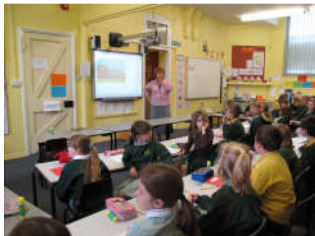
Σχολική τάξη στο Newport

Ένα σχολείο «ονειρεμένο» από άποψη υλικοτεχνικών υποδομών, με την απέραντη αυλή, τις αίθουσες εκδηλώσεων και τους διαδραστικούς πίνακες σε κάθε τάξη.