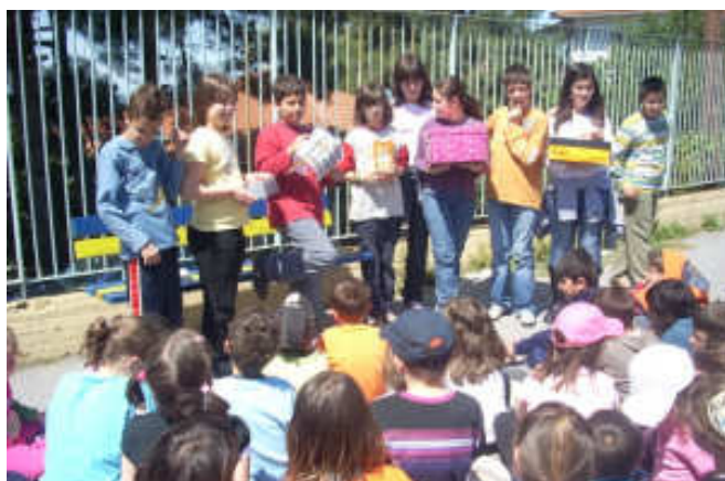
Μαθητές και μαθήτριες παρουσιάζουν τους "θησαυρούς" τους