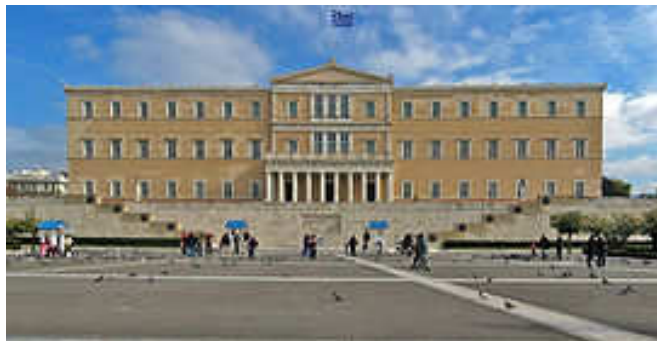
Η Βουλή των Ελλήνων

Το Ίδρυμα της Βουλής των Ελλήνων για τον Κοινοβουλευτισμό και τη Δημοκρατία οργανώνει κάθε χρόνο προγράμματα επίσκεψης μαθητών της τελευταίας τάξης της Πρωτοβάθμιας και όλων των τάξεων της Δευτεροβάθμιας Εκπαίδευσης στη Βουλή των Ελλήνων.