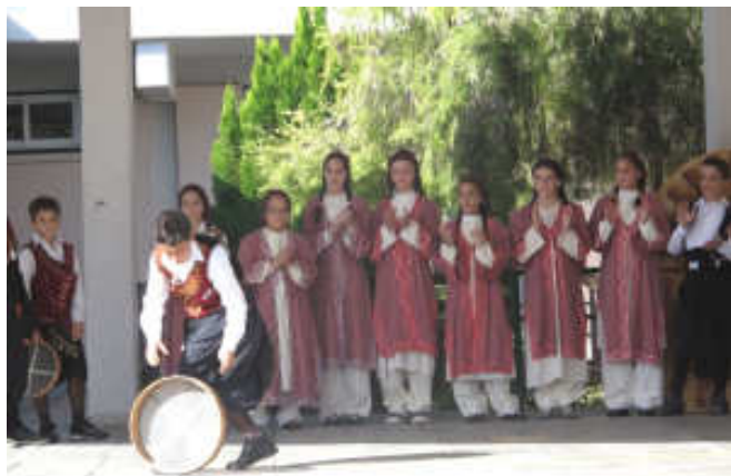
Μαθητές και μαθήτριες του Δημ. Σχολείου Καρμιώτισσας παρουσιάζουν παραδοσιακούς χορούς της Κύπρου

Το Νοέμβριο πραγματοποιήθηκε η εκπαιδευτική συνάντηση στο Δημοτικό σχολείο της Καρμιώτισσας στην Κύπρο. Εκπαιδευτικοί και παιδιά παρουσίασαν στοιχεία του πολιτισμού και της ιστορίας τους. Μας γέμισαν με συγκίνηση και μείναμε με τις καλύτερες εντυπώσεις.