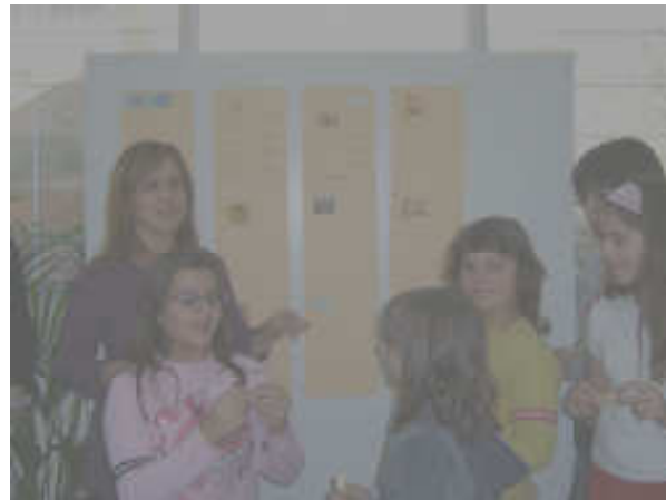
Μαθήτριες διαβάζουν τις λέξεις σε διαφορετικές γλώσσες και τις κολλούν στον ειδικά διαμορφωμένο πίνακα

Στις 20 Νοέμβρη γιορτάσαμε στο σχολείο μας την Παγκόσμια Ημέρα Γλωσσών. Μαζέψαμε λέξεις σε διάφορες γλώσσες, όπως: Αγγλικά, Γερμανικά, Ιταλικά, Πορτογαλικά, Αλβανικά, Σουηδικά, Σέρβικα, Ρωσικά, Ισπανικά, Γαλλικά. Μια δραστηριότητα για την ευαισθητοποίηση στην αποδοχή και το σεβασμό των διαφορετικών πολιτισμών στην Ευρώπη.